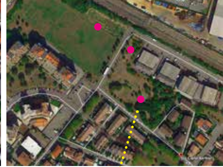
AREA VERDE DI VIA BARBIERI - GAGA B