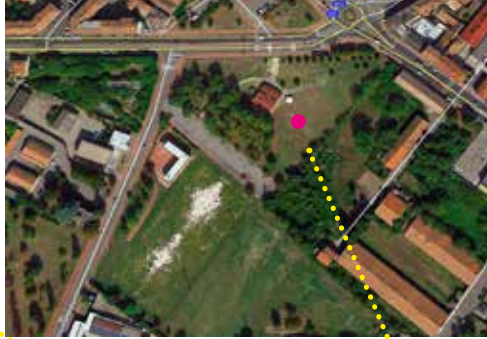
AREA VERDE DI SPAZIO 4