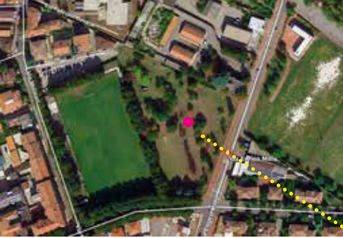
GIARDINO DON ALDO CORBELLETTA