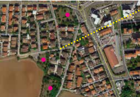
AREE VERDI VIE RIGOLLI SPEZZAFERRI